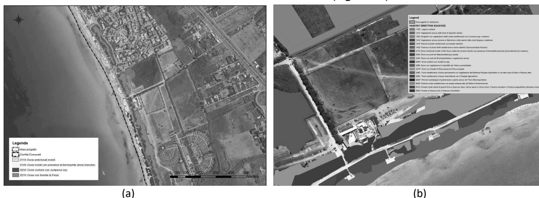
Figura 2 - (a) Habitat di interesse comunitario individuati dalla DGR 2442/2018; (b) Stralcio della Carta degli habitat di interesse comunitario come riportata nel Piano Territoriale del PNR "Isola di S. Andrea e Litorale di Punta Pizzo".

La componente Habitat, flora e fauna del sito in cui ricade il parcheggio viene caratterizzata e descritta sia per l'area vasta circostante avente un buffer pari a 10 km, sia per un'area di dettaglio con buffer di 1 km. Nella Figura 2 sono rappresentati gli habitat di interesse comunitario distribuiti nell'area d'intervento secondo la DGR 2442/2018 (Figura 2a) e la cartografia degli habitat contenuta nel Piano Territoriale del PNR "Isola di S. Andrea e Litorale di Punta Pizzo" (Figura 2b).