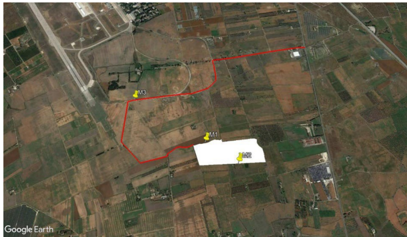
Figura 3.1: Individuazione punti di emissione e punti monitoraggio

Di seguito si riporta la rappresentazione su ortofoto dei punti emissivi (in rosso la viabilità e in bianco l'area dell'impianto agrovoltaico "Torre Pinta").