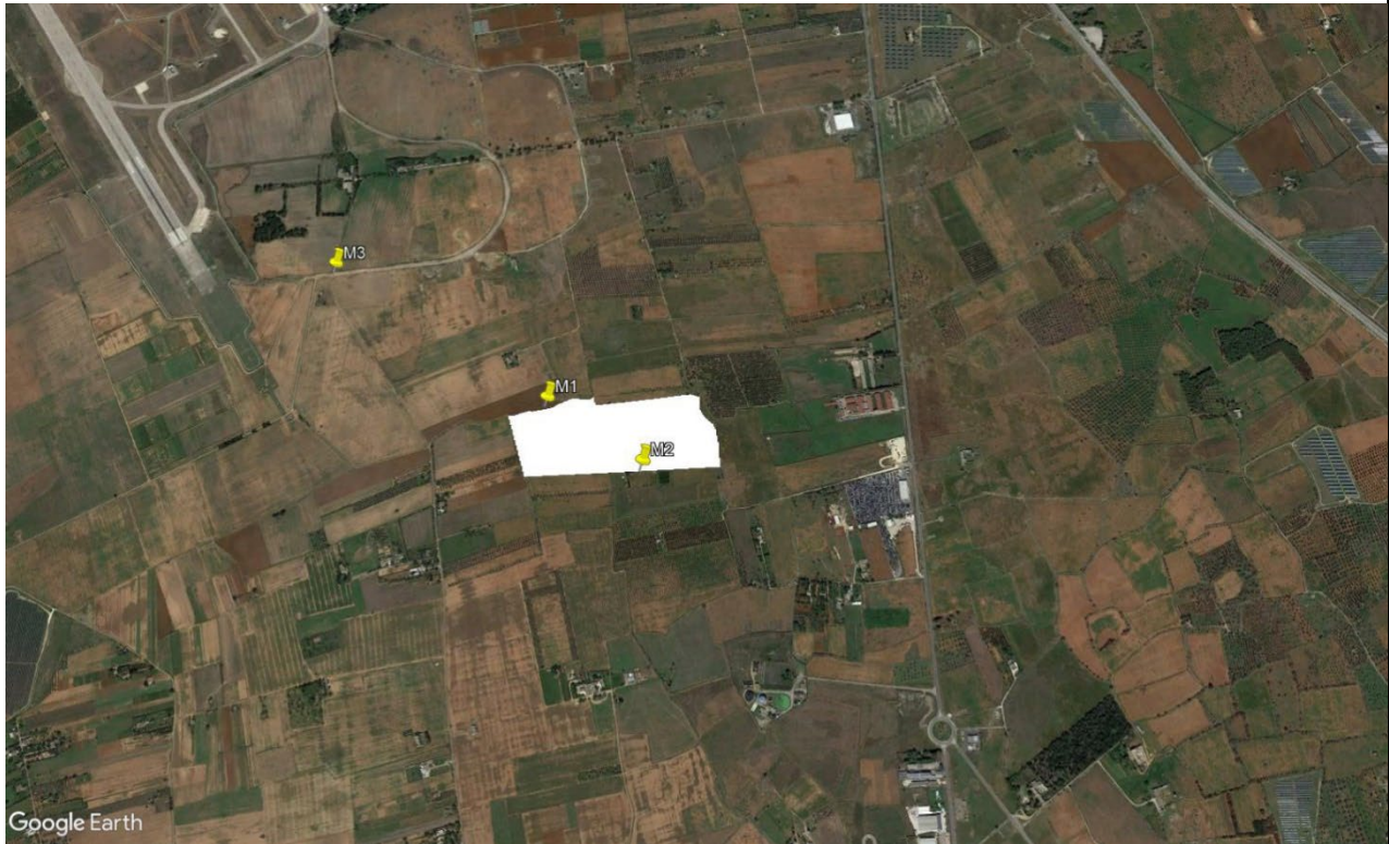
Figura 2.4: Individuazione punti di monitoraggio (M1-M2-M3) rispetto alla posizione dell'impianto agrovoltaiico