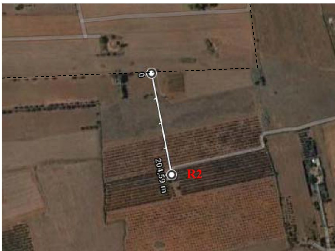
Figura 2.3: Distanza ricettore R2 dal confine dell'impianto agrovoltaico

In relazione ai ricettori sensibili individuati e agli impatti sull'atmosfera riscontrati nello SIA due punti di monitoraggio (M1 e M2) saranno collocati in prossimità del confine dell'area d'impianto in corrispondenza della minore distanza relativa.