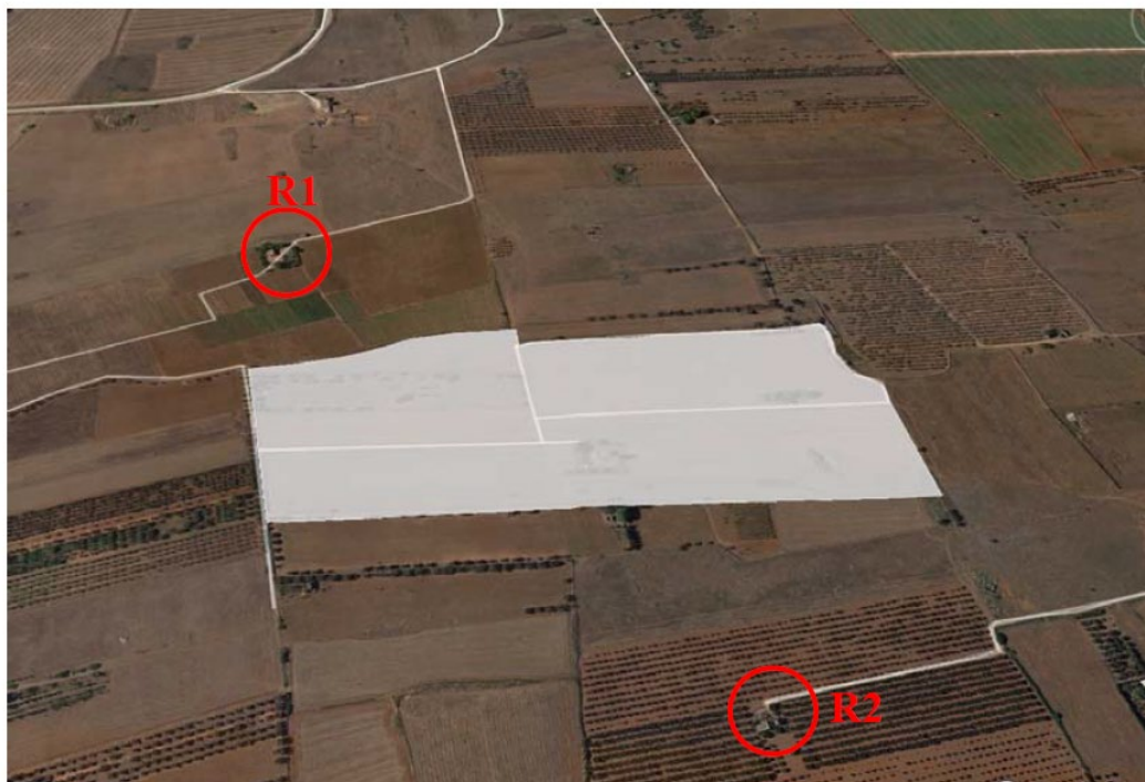
Figura 2.1: Stralcio ortofoto – ricettori R1, R2 e impianto