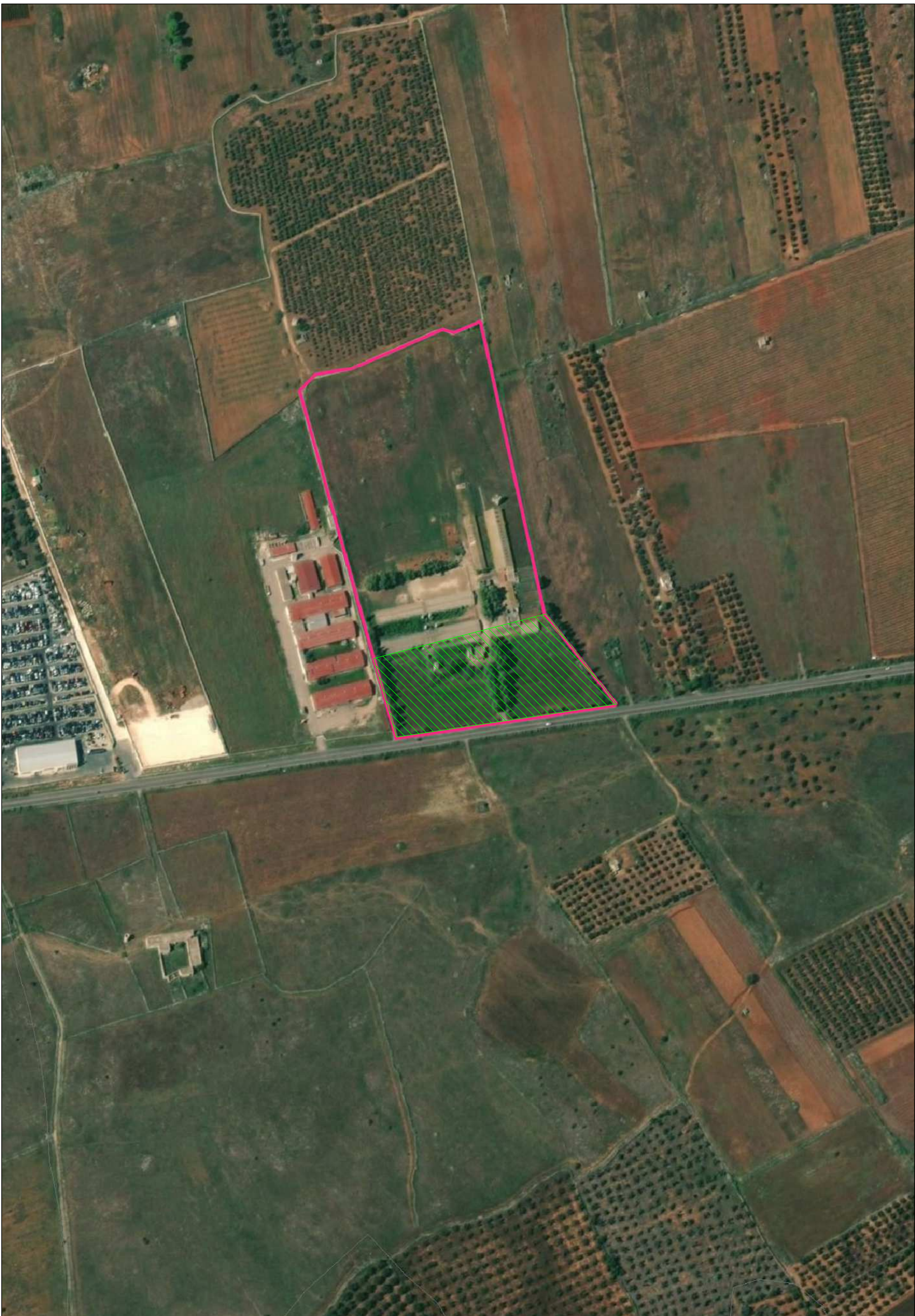
Immagine satellitare scala 1:5.000