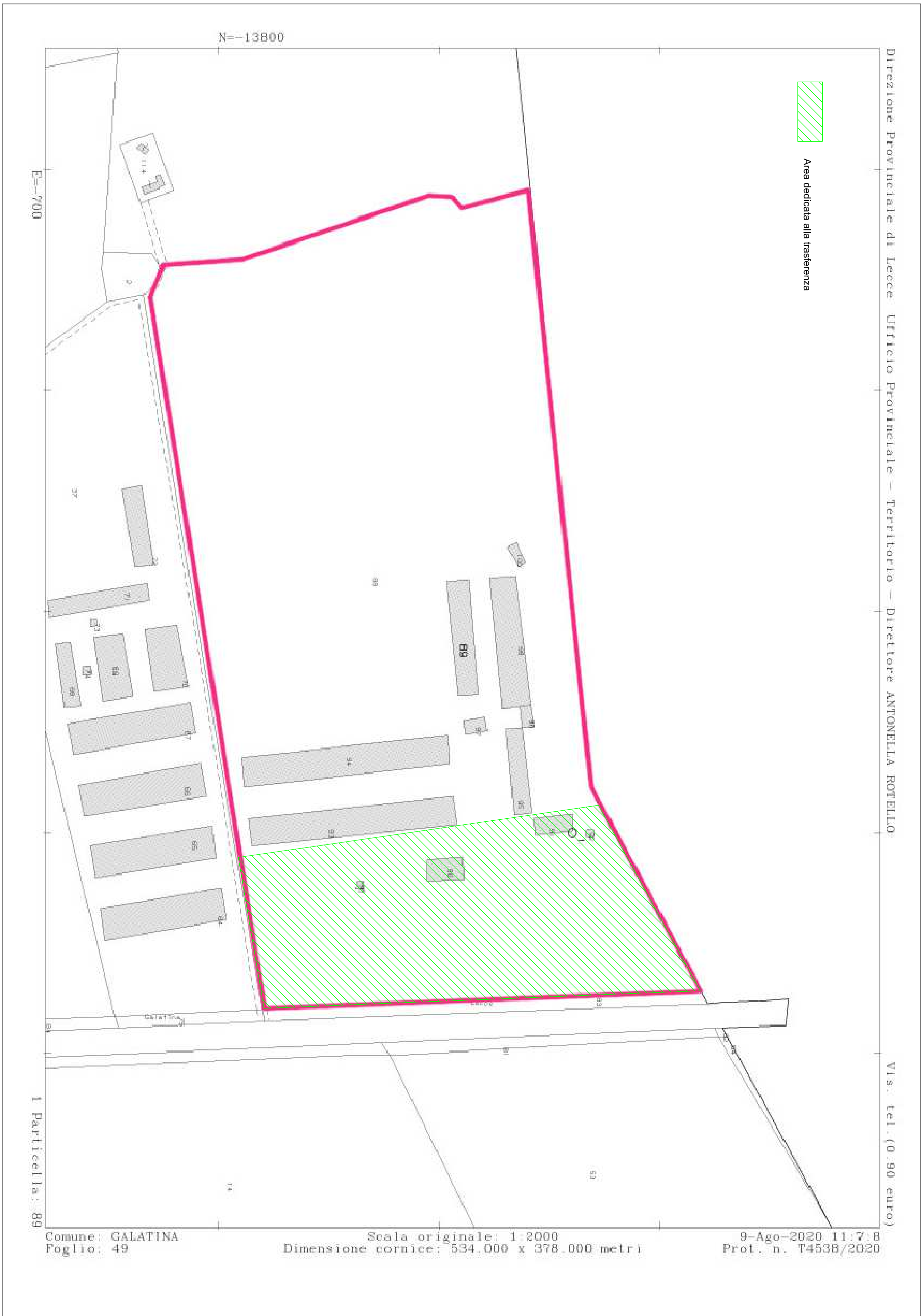
Stralcio catastale scala 1:2.000