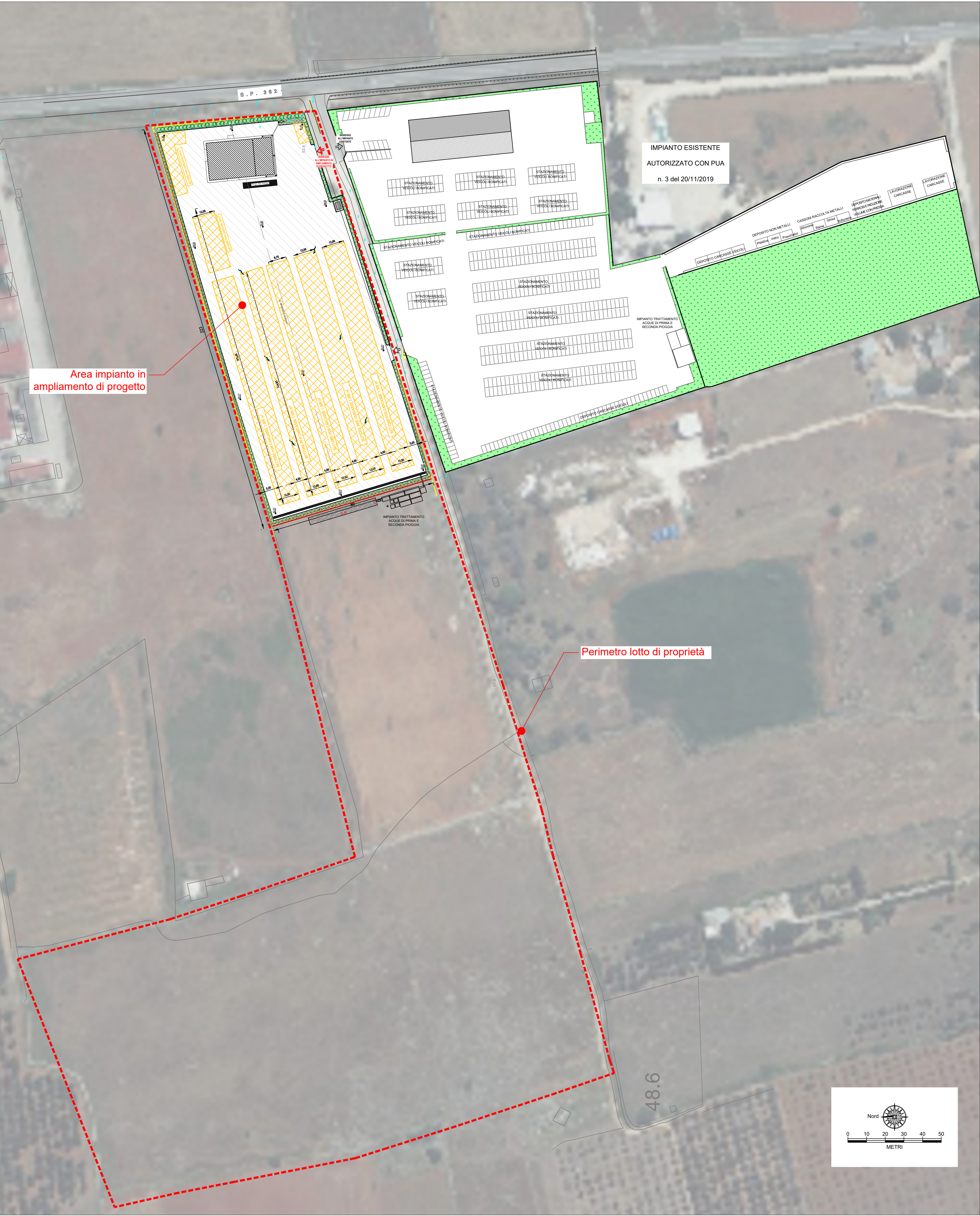
PLANIMETRIA GENERALE DELL'INTERO LOTTO Scale 1:1.000